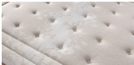
Tessuto Lino 3D: tessuto "Natural & Eco-friendly based", termoregolatore, antistatico e anallergico, fresco, morbido e delicato sulla pelle.

Soft Air System: side band with inner 3D breathable fabric, with a sturdy all-round side handle for easy positioning on the bed.