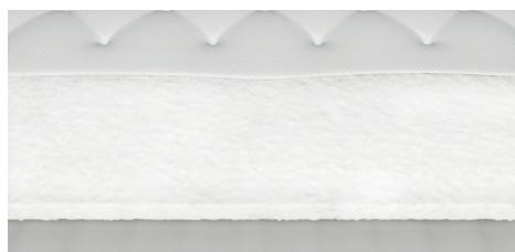
Imbottitura EcoMemory, presente nella versione Memory sfoderabile, su un lato.

3D Linen fabric, "Natural & Eco-friendly based" fabric, it is heat regulating, antistatic and anti-allergy, fresh, soft and delicate on the skin.