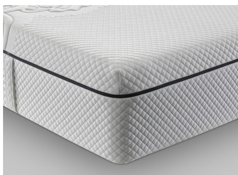
TOPPER INTERNO COMFORT (one side)