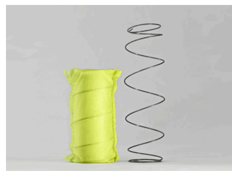
ExE 1.2 POCKET: sostegno attivo, progressivo, bilanciato