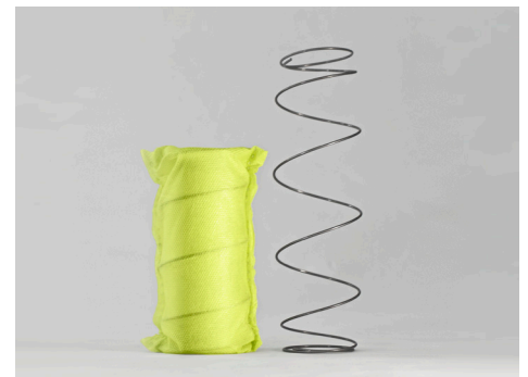
ExE 1.2 POCKET: sostegno attivo, progressivo, bilanciato