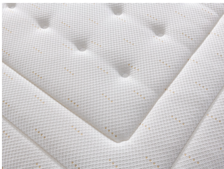
TOPPER CON TRAPUNTATURA profonda effetto Capitoné per esaltare il comfort