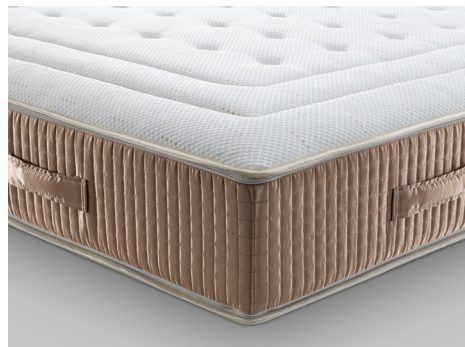
TOPPER COMFORT (two sides) con imbottitura EcoMemory doppio strato (su un lato) e imbottitura Trio System Climatech alto spessore (su altro lato)