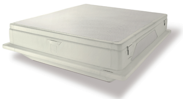
Optic white cod. ow03