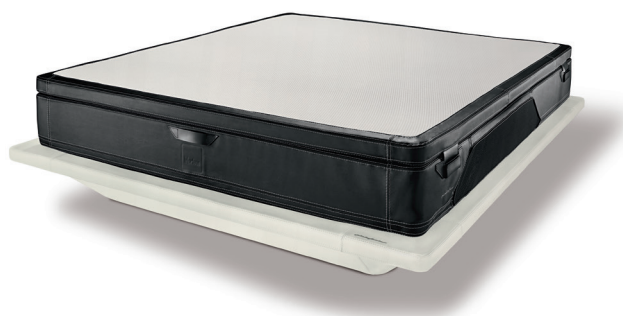
All black cod. ab04