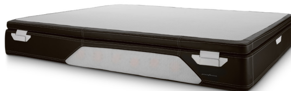
Black/white cod. bw01