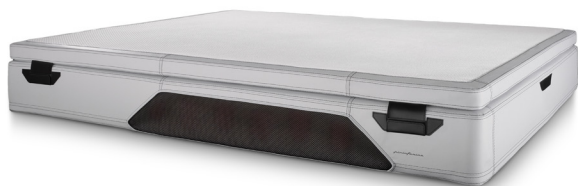
Silver/black cod. sb02