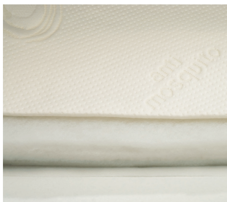
Imbottitura in fibra "Clima 4 Stagioni", climatizzata per ogni stagione, antipolvere, anallergico.

Silver+ fabric, sanitised with a silver based treatment.