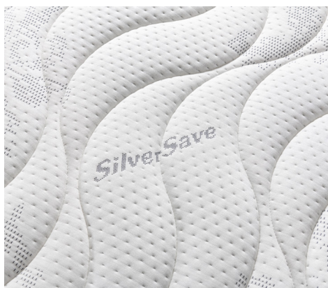
Tessuto Silver+, igienizzato con trattamento a base d'argento.

Clima Fix: with anti-allergy, mite-proof and anti-dust filling in "Clima 4 Seasons" fibre, climate-controlled for each season (on both sides). Silver+ fabric: elasticated "Silver+" fabric, sanitised with a Silver+ silver based treatment, mite-proof, anti-allergy, anti-static. Air side band: 3D breathable mesh fabric, with a sturdy all-round handle in exclusive micro-fibre fabric.