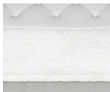
Imbottitura GelMemory (1 lato)