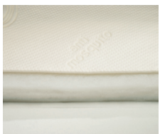
Imbottitura ClimaWood (2 lati)