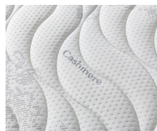
Tessuto SilverSave Cashmere

Washability: the cover is removable and can be washed in water at 30° C.