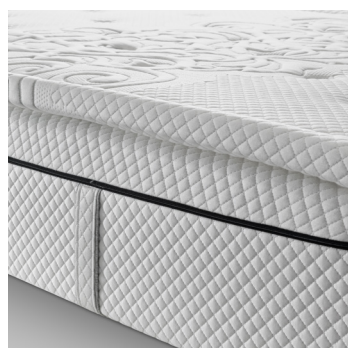
TOPPER ESTERNO SOFT COMFORT (one side)