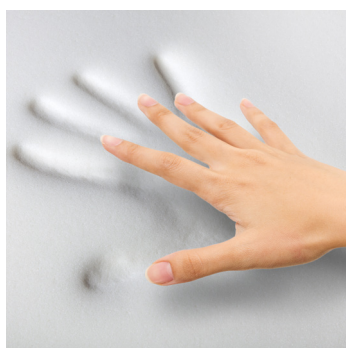
TOPPER INTERNO ERGONOMICO: strato di Ecomemory UltraSoft