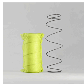
ExE 1.2 POCKET: sostegno attivo, progressivo, bilanciato