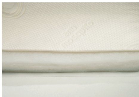
Imbottitura ClimaWood in fibra climatizzata derivata da pasta di legno naturale, anallergica, antiacaro, antipolvere (2 lati).

SilverSave Cashmere fabric sanitised with pure silver thread ions, mite-proof, anti-allergy, anti-stress, anti-static, odourless, heat regulating.