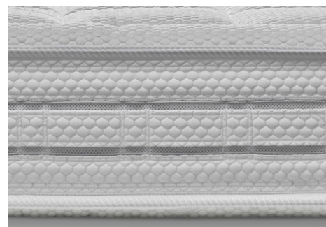
Fascia Top Air: Realizzata con accoppiatura di tessuto SilverSave e tessuto interno traspirante 3D.

ClimaWood filling in climate-controlled fibre made from natural wood pulp, anti-allergy, mite-proof, anti-dust (2 sides).