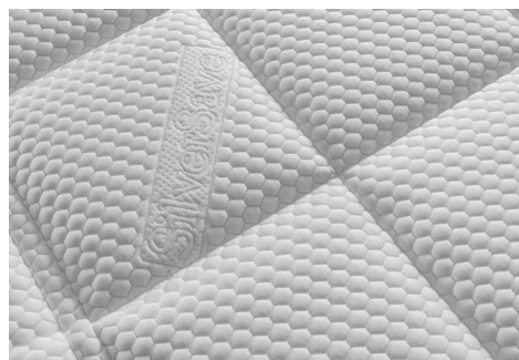
Tessuto SilverSave Cashmere igienizzato con ioni di puro argento, antiacaro, anallergico, antistress, antistatico, inodore, termoregolatore.

SilverSave Cashmere fabric sanitised with pure silver thread ions, mite-proof, anti-allergy, anti-stress, anti-static, odourless, heat regulating.