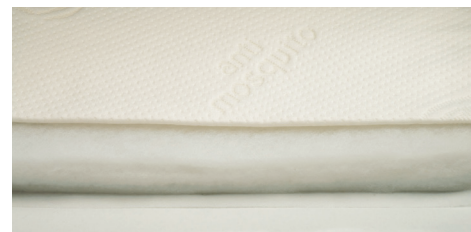
Imbottitura Climawood, fibra climatizzata derivata da pasta di legno naturale.

EcoMemory filling, available with the removable Memory version, on one side.