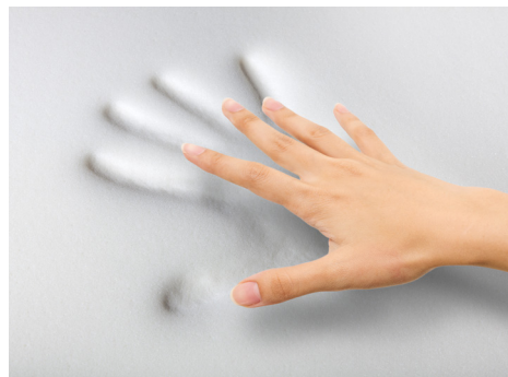
TOPPER INTERNO: Strato di contatto Soft in EcoMemory h cm 3 ca.