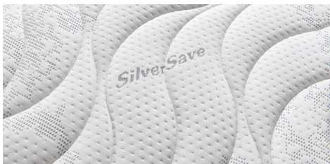
Tessuto Silver+, igienizzato con trattamento a base d'argento.

Air side band: 3D breathable mesh fabric, with a sturdy all-round handle in exclusive micro-fibre fabric.