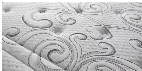
Tessuto Seta/Silk: morbido, fresco, rivitalizzante.

Soft Air System: side band with inner breathable fabric, with a sturdy all-round side handle for easy positioning on the bed.