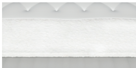
Imbottitura EcoMemory, presente nella versione Memory sfoderabile, su un lato.

Silk/Silk fabric: soft, fresh, revitalising.